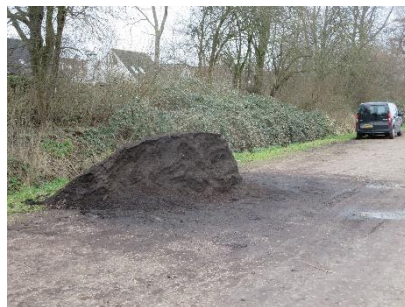
en zo wel

Bij het afnemen van de bestelling is het de bedoeling, dat eerst de rijbaan wordt vrijgemaakt en zo geleidelijk wordt doorgedaan tot de slootberm is bereikt en alle compost is verdwenen.