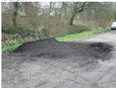
zo dus niet

> Voor de levering van stalmest, wormengrond en compost worden op basis van de bestellingen per laan stortlocaties bepaald. Het is voor de chauffeurs echter lastig om per locatie de juiste hoeveelheid te storten. Zo kan het dus gebeuren, dat op de ene plek te veel en op een andere plek te weinig ligt. Dat betekent dat leden, die hun bestelling niet op de aangegeven datum kunnen afnemen, wat verder moeten kruien.